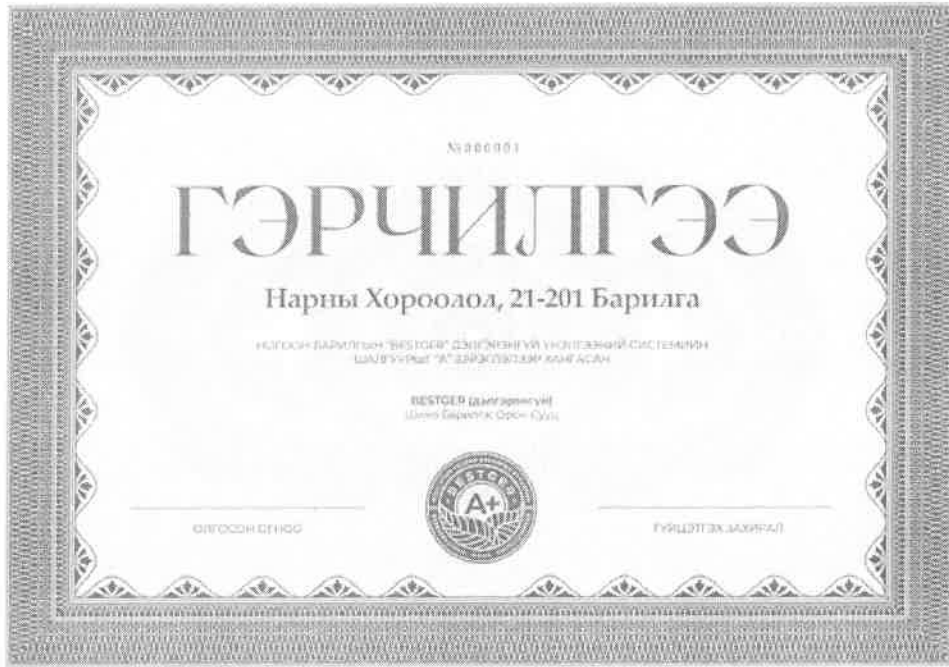
(Ногоон барилга (BestGER) гэрчилгээний загвар )