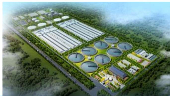
Улаанбаатар хотын төв цэвэрлэх байгууламжийг шинээр барих төсөл