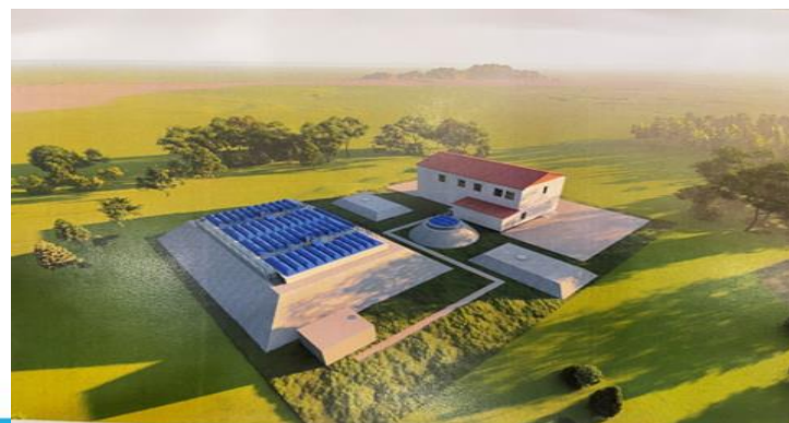
Аймгуудын бохир ус цэвэрлэх байгууламжийн өргөтгөл шинэчлэлтийн төсөл