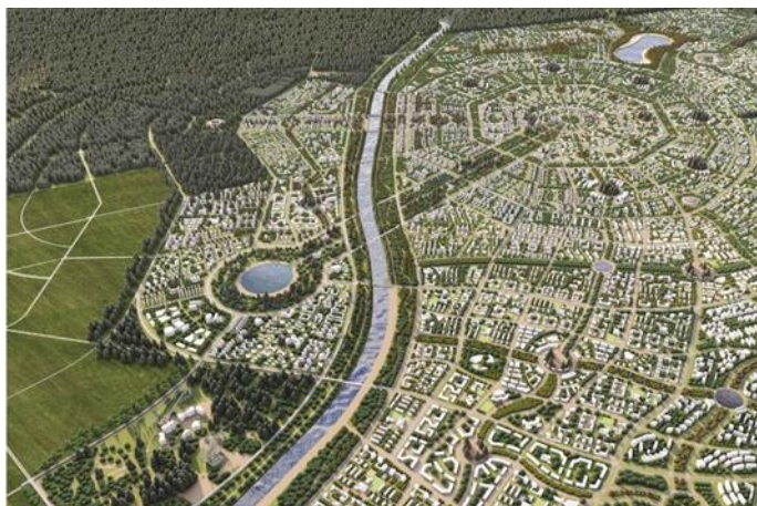
Шинэ Хархорум хот байгуулах төсөл