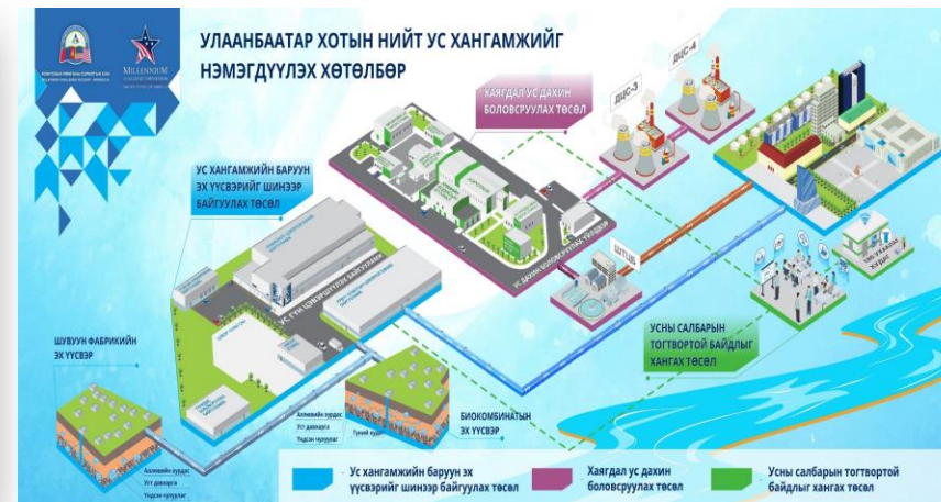
Улаанбаатар хотын ус хангамжийг нэмэгдүүлэх хөтөлбөр