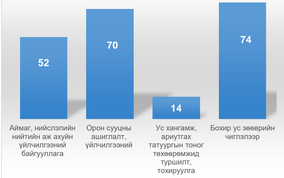
Тусгай зөвшөөрөл эзэмшигчид

Тусгай зөвшөөрөл эзэмшигч байгууллагууд хоногт дунджаар 486 мян.м 3 усыг олборлон унд ахуйн хэрэгцээнд түгээж, хэрэглээнээс гарсан бохир усыг татан зайлуулж цэвэрлэж, ус хангамжийн 3,772 км, бохир усны 1,875 км шугам сүлжээний ашиглалт, үйлчилгээг хариуцан ажиллаж байна.