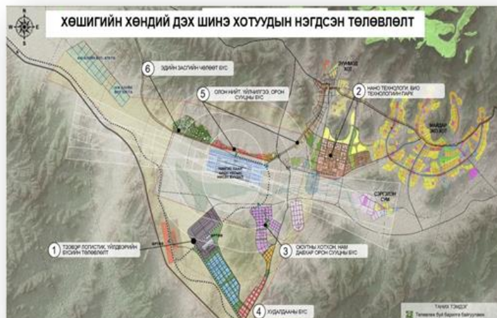
“Шинэ Зуунмод хот”-ын бүтээн байгуулалтын эхний ээлжийн бүтээн байгуулалтын төсөл